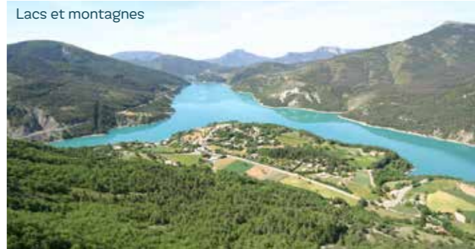
Lacs et montagnes

Objectif de la charte : améliorer l'habitat sans sacrifier la qualité des paysages, les espaces naturels et agricoles.