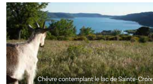
Chèvre contemplant le lac de Sainte-Croix

Objectif de la charte : accompagner l'adaptation des activités économiques au changement climatique et à la transition énergétique.