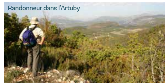
Randonneur dans l'Artuby