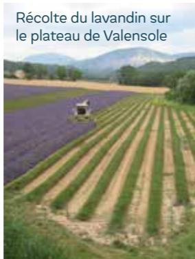
Récolte du lavandin sur le plateau de Valensole

Entre Alpes et Méditerranée, le Verdon est un territoire très diversifié : mosaïque de 7 zones paysagères articulées autour de la rivière ; il abrite 2 200 espèces de plantes (1/3 de la flore française) permettant une grande diversité animale qui se traduit par l'importance d'espèces communes et la présence d'espèces remarquables, telles que l'Outarde canepetière, le Lézard ocellé, 22 espèces de chauves-souris... On retrouve la même richesse sur le plan géologique, archéologique, historique, artistique... Le Verdon est un territoire de confluence aux multiples identités.