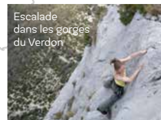
Escalade dans les gorges du Verdon

Objectif de la charte : préserver la diversité du tissu économique, structurer et valoriser les activités emblématiques.