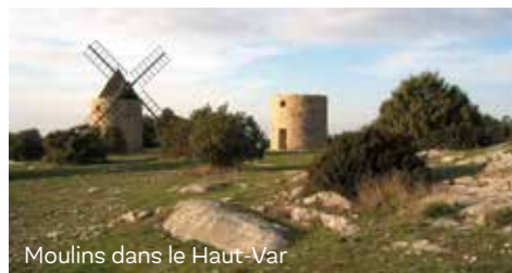
Moulins dans le Haut-Var

Objectif de la charte : assurer la gestion et l'utilisation équitable de l'eau