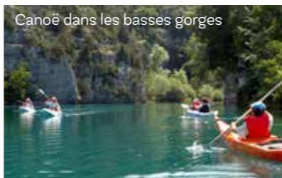
Canoë dans les basses gorges

Depuis la grotte de la Baume Bonne, qui permet de lire sa présence depuis 500 000 ans, l'homme a marqué le territoire d'une présence inventive. Les vestiges, les arts et traditions, l'héritage rural qui a façonné l'habitat et peigné les terres, montrent que, de tous temps, il a su trouver les réponses aux exigences d'une terre qui n'est pas un « pays de cocagne » (murs en pierre sèche, aménagements hydrauliques...)